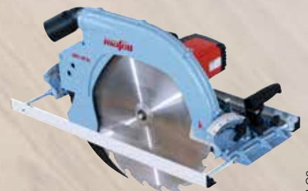
Zimmerei-Handkreissäge MKS 185 Ec

Angebot: 4.047,- zzgl. MwSt. Listenpreis: 4.260,- CHF