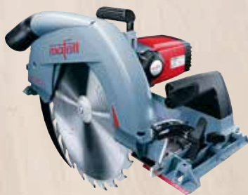
Zimmerei-Handkreissäge MKS 130 Ec